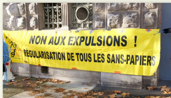
Tribunal Administratif de Clermont-Ferrand le 6 décembre 2022

Pour ne pas laisser s'installer le silence sur ces pratiques honteuses, le RESF63 appelle à construire partout, dans les écoles, les collèges, les lycées, des mouvements de solidarité et de lutte.